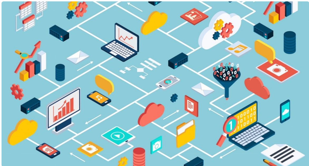
Ilustrasi big data

Kualitas data yang baik merupakan hal yang krusial dalam pemanfaatan data untuk keperluan bisnis. Data yang akurat, terpercaya, dan relevan akan memberikan hasil yang lebih optimal dalam proses pengambilan keputusan. Dalam meningkatkan kualitas data, perusahaan harus memiliki kebijakan dan prosedur yang baik dalam pengumpulan, pemrosesan, dan validasi data. Sumber data yang beragam dan terintegrasi juga menjadi faktor penting dalam menghasilkan wawasan yang komprehensif.